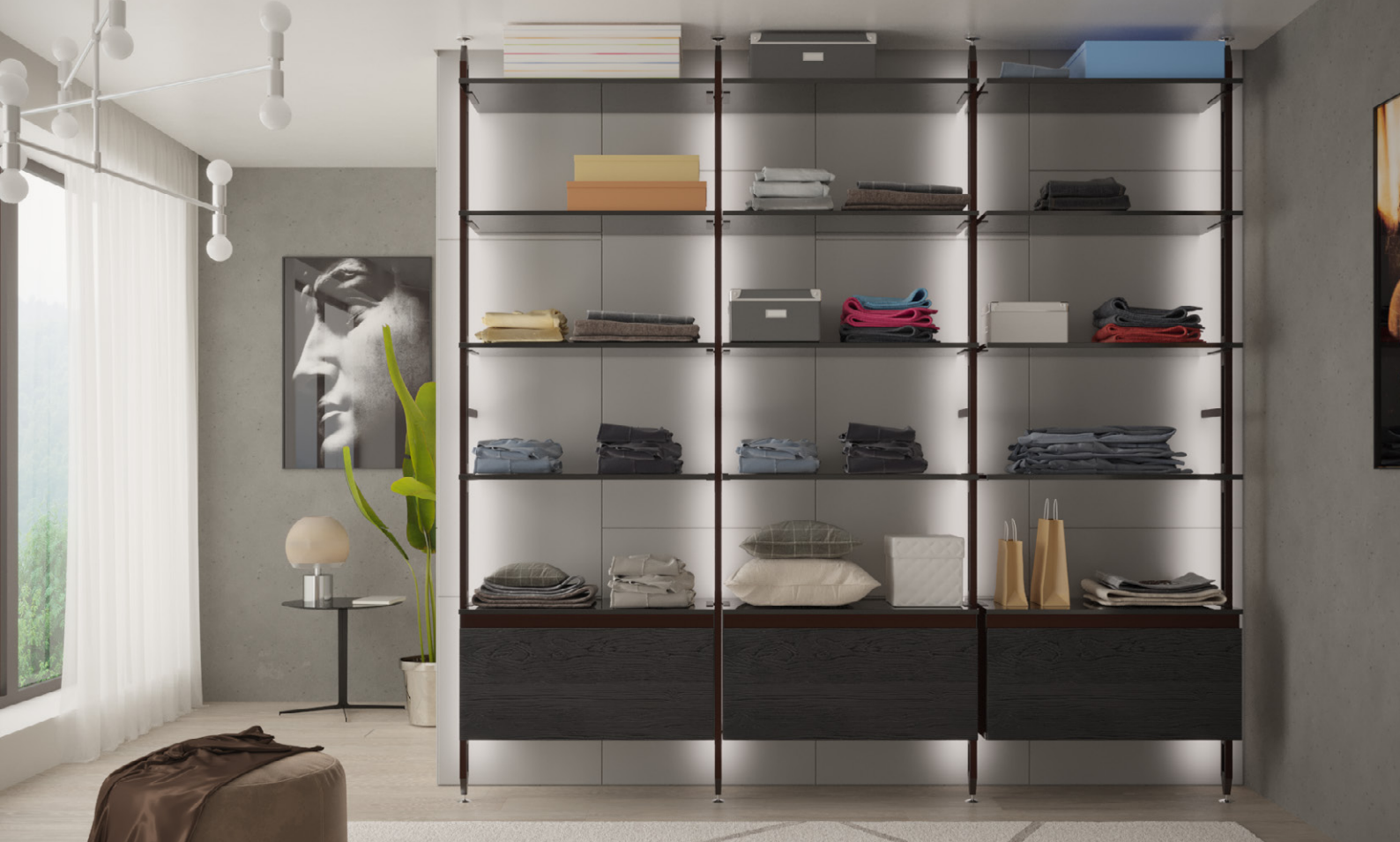
Стелажна система «ПІДЛОГА-СТЕЛЯ», специфікація для глибини каркаса 220мм і 3-х секцій по 900мм